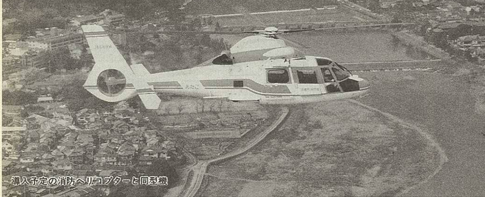
購入予定の消防ヘリコプターと同型機

6月定例会では、北九州市個人情報保護条例の制定ほか、消防ヘリコプターの取得、(仮称)西南女学院大学設立補助を内容とする補正予算などの議案を可決しました。