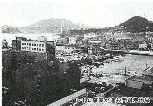
レトロ事業が進む門司港地域