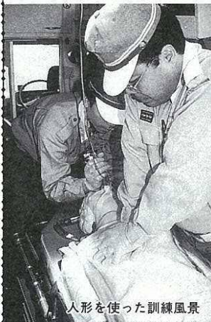
人形を使った訓練風景

この施設は、全国から救急救命活動に従事する人を集め、地域医療機関との連携を通じて養成するもので、現在、産業医科大学の全面的な協力や、地元医師会、