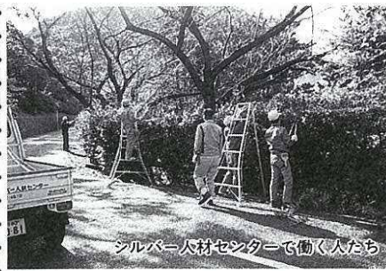
シルバー人材センターで働く人々