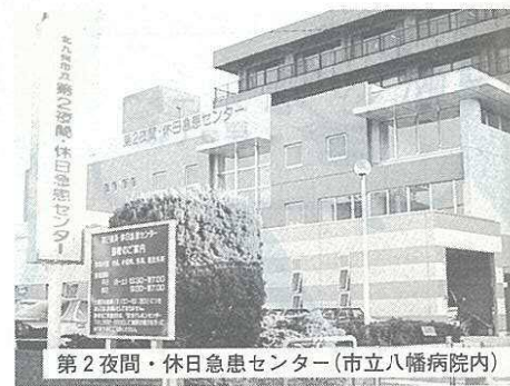
第2夜間・休日急患センター(市立八幡病院内)

保健福祉局長 年末年始は、既に二つ急患センターで二十四時間体制の診療を実施している。井堀の急患センターは執務をうる大病院の勤務時間帯との調整が困難なため、大型連休期間中は通常の休日と同じ診療を行っている。一方、八幡の急患センターはこれまで井堀の急患センターと同一の診療時間になっているが、今後市民のニーズ等を見ながら医師会や周辺病院等で構成する協議会に諮りたい。