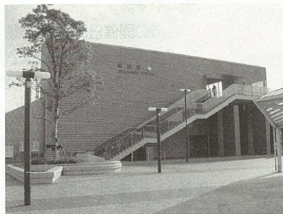
JR陣原駅 (JR黒崎駅・折尾駅間に平成12年11月21日開業)

や結節機能の強化等に取り組んできた。また、本年二月に、北九州市公共交通戦略プランを策定し、四月には市民バスネット協議会を発足させた。今後は、この協議会の中で利便性の向上や新たな生活交通の確保の点からも十分に協議を重ね、市民、関係機関、交通事業者と連携し公共交通の充実強化に取り組みたい。