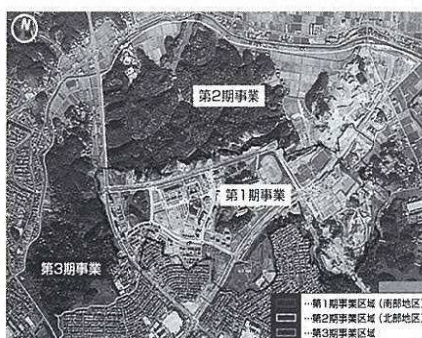
学術研究都市整備事業

学術研究都市は、環境・情報分野を中心に、大学と企業が連携して研究を行うことを目的に整備している。現在、四つの大学と、半導体関連企業を中心に三十八社が進出している。しかし、学術研究都市が出来てまだ数年であり、まちとしては成長段階である。今後、さらに人や企業が集まり、生活に必要な施設への需要が高まれば、自然と民間投資により整備されると考える。市としては、これまでの学術研究拠点としての取組をベースに、さらに産学連携の仕組づくりを進めるための整備を行いたい。