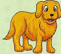
ゴールデンレトリバー