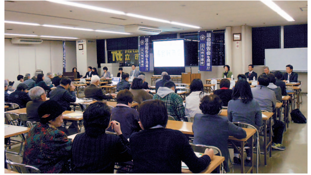
八幡西区で開催された議会報告会の様子

次回の報告会は平成24年5月頃に門司区、若松区、八幡東区での開催を予定しております。くわしくは次号市議会だよりでお知らせいたします。