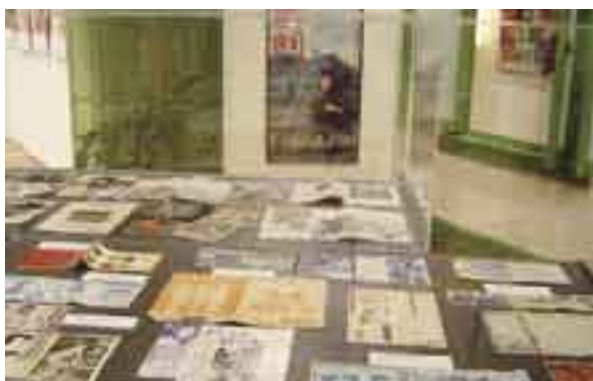
平成20年3月8日 海峡ドラマシッ「松永文庫の世界」展風景