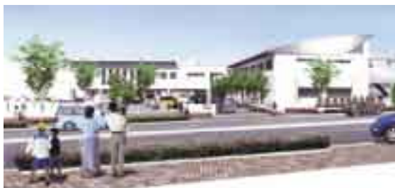
（仮称）島郷市民センターほか複合公共施設（イメージ）