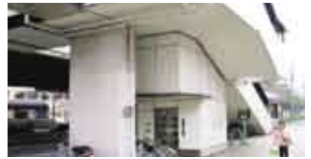
都市モノレール停留場バリアフリー化整備 エレベーター設置（イメージ）

なお、現在都市モノレール徳力嵐山口停留場のバリアフリー化整備を平成20年度より進めています。（平成22年度末 供用開始予定）